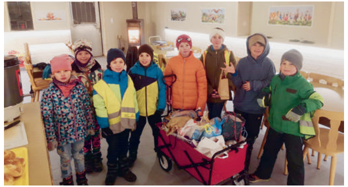
Alte Chäsi in Heldswil

Das Jahr 2023 wurde von den Schülerinnen und Schülern mit lautem Lärm verabschiedet. Fröhlich zogen sie von Haus zu Haus, um die bereitgelegten Säckli abzuholen und die Bewohnerinnen und Bewohner aus dem Bett zu lärmern. Anschliessend wurden die vielen Gaben gerecht untereinander aufgeteilt. Dieser Anlass war wiederum sehr gelungen und machte den Kindern riesig Spass. Danke allen Helfern, die das Silvesterläuten jedes Jahr möglich machen.