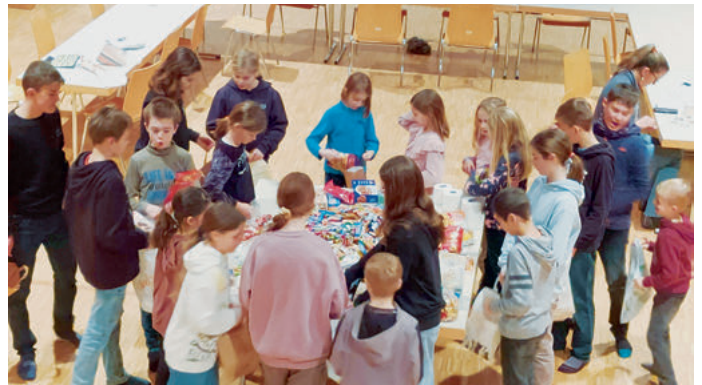
Hirschenschür in Hohentannen