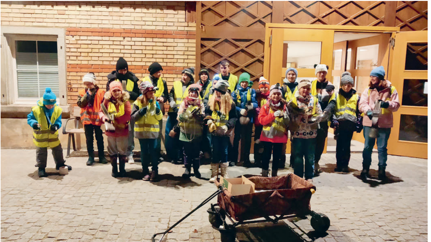
Das Jahr 2023 wird von den Kindern in Hohentannen und Heldswil mit lautem Lärm verabschiedet.