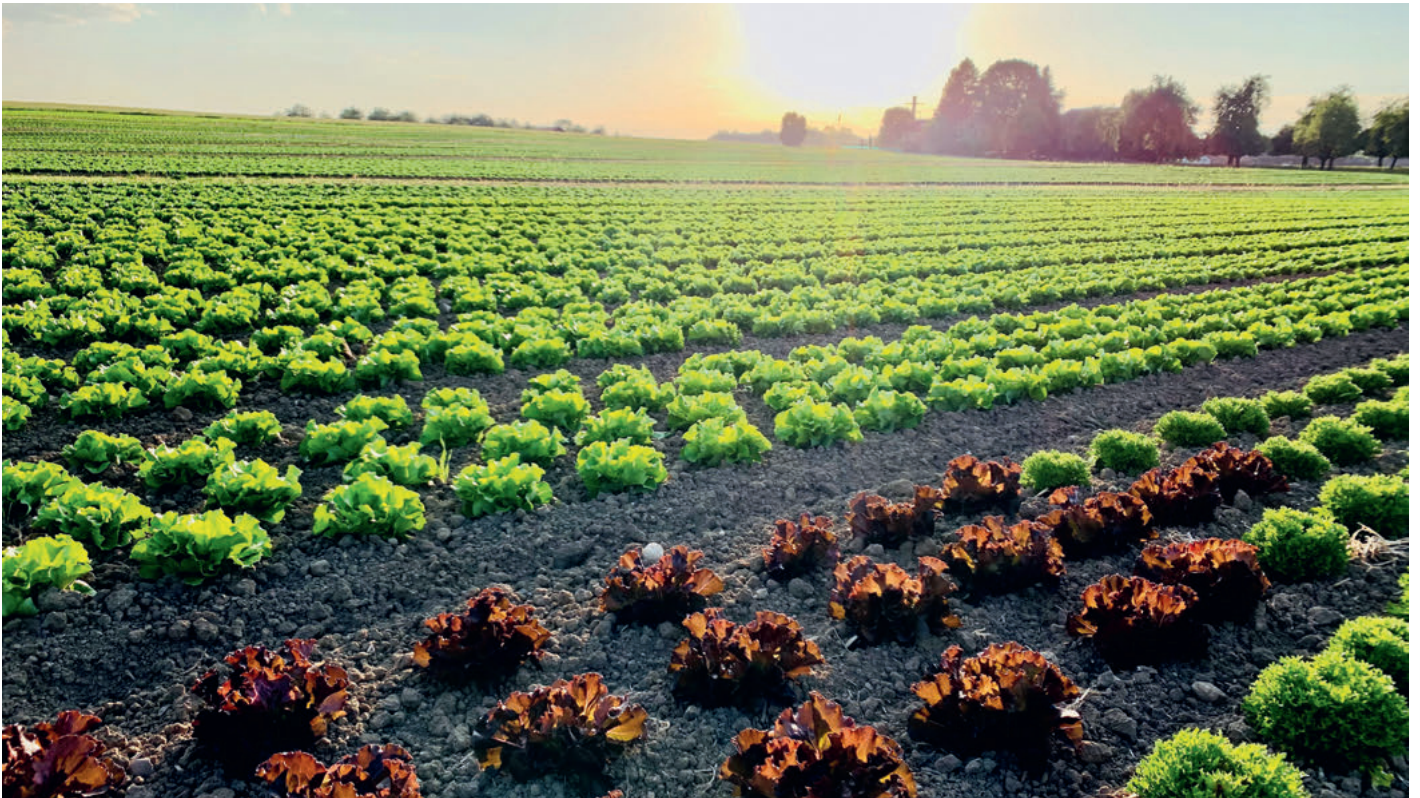
Vielfältige Landwirtschaft in der Gemeinde Hohentannen